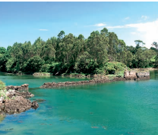
molino de As Acías

Ruta lineal de unos 8 km (ida y vuelta) que une las localidades de Castropol y Figueras , discurre al borde de la ría del Eo y ofrece unas magníficas vistas de la misma.